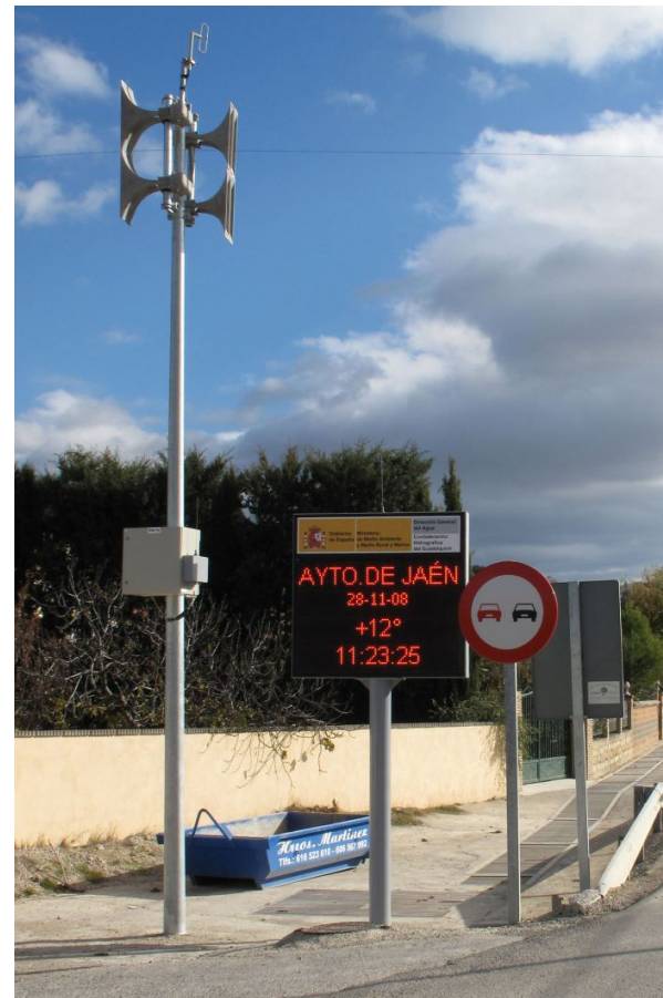
Detalle de la instalación en Jaén